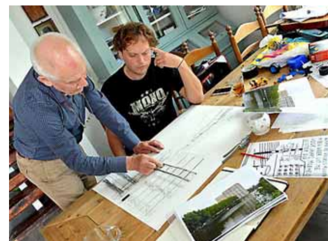
„Zo'n gevel vraagt om harde lijnen”.