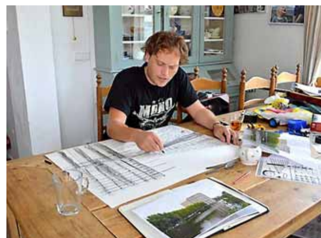
„Zo! Ja, nu komen we ergens.”