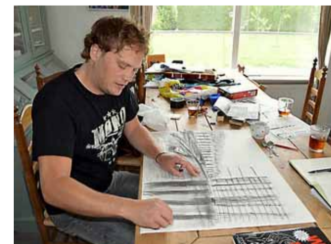
De Oostdorsch weerspiegeld in het water.