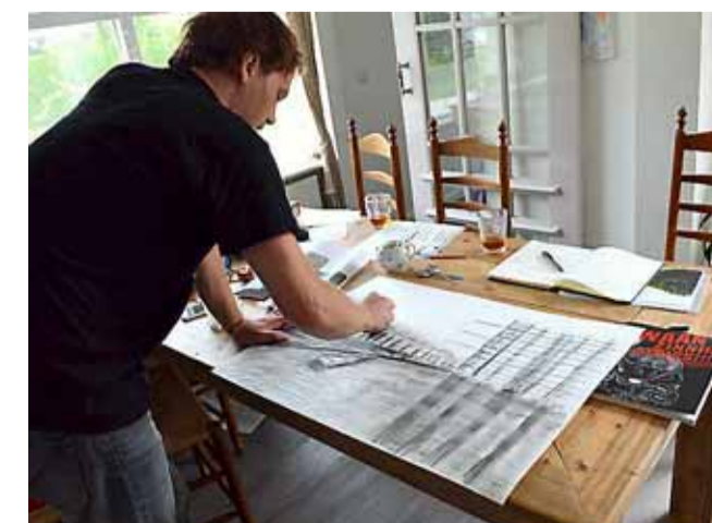
„Gaat goed hoor, laat mij maar even mijn gang gaan.”